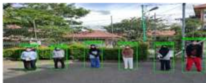
Gambar 5. Hasil Foto Orang Tidak Berkerumun

Pengujian ini dilakukan dengan memilih salah satu foto orang yang tidak berkerumun. Salah satu hasil pengujian dapat dilihat pada gambar 5.