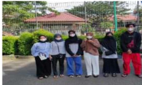
Gambar 1. Foto Orang Berkerumun

Dalam penelitian ini data yang digunakan adalah dataset sendiri yang diambil menggunakan kamera handphone 16 MP. Data yang digunakan berupa data foto. Data foto yang digunakan adalah 50 foto, di mana 25 foto orang berkerumun dan 25 foto orang yang tidak berkerumun. Data tersebut di- augmented menjadi 1000 foto. Data pertama yang digunakan adalah data foto di mana terdapat 5 orang atau lebih dalam kondisi yang memiliki jarak satu sama lain kurang dari 1 meter. Data ini diklasifikasikan sebagai data berkerumun. Data foto orang yang berkerumun dapat dilihat pada gambar 1.