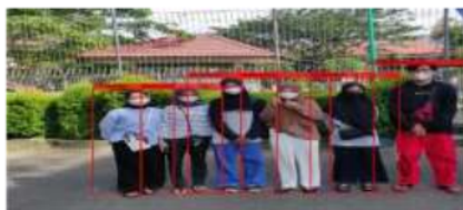
Gambar 4. Hasil Foto Orang Berkerumun

Pengujian ini dilakukan dengan memilih salah satu foto orang berkerumun. Salah satu hasil pengujian dapat dilihat pada gambar 4.