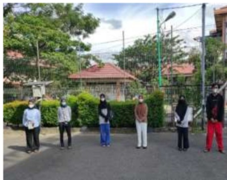
Gambar 2. Foto Orang Tidak Berkerumun

Data kedua yang digunakan adalah data foto di mana terdapat beberapa orang dalam kondisi yang berjarak lebih dari 1 meter satu sama lain. A (21) yang berdekatan, namun jumlahnya tidak mencapai 5 orang atau lebih. Data foto orang yang tidak berkerumun dapat dilihat pada gambar 2.