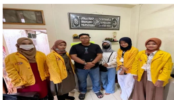
Gambar 2 Dokumentasi Kegiatan Dengan Pemilik UMKM