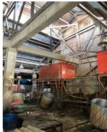
Gambar 2. Foto Lokasi Tempat Pembuatan Tahu

Masalah yang ditemukan di Pabrik Tahu Alami yaitu proses pemasaran yang belum optimal jika dibandingkan dengan kompetitor lainnya. Kompetitor lain sudah menggunakan media promo untuk pemasaran serta memiliki pengecer di daerah lain untuk proses penjualan. Oleh sebab itu agar usaha dapat bersaing dan berkembang, diperlukan adanya strategi pemasaran di Pabrik Tahu Alami. Tingginya kandungan protein dan lemak pada tahu mengakibatkan tahu termasuk bahan makanan cepat busuk, karena protein dan lemak merupakan media yang baik untuk pertumbuhan jasad renik pembusuk seperti bakteri (Sarwono & Saragih, 2004). Daya simpan tahu yang cukup pendek menyebabkan penjualan tahu harus cepat agar tahu yang diproduksi tidak busuk.