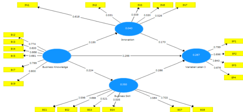
Gambar 2 Path Analysis

Pengujian data dengan menggunakan SmartPLS secara umum, memiliki 2 tahap, tahap pertama adalah pengujian outer model yaitu pengujian untuk menyaring semua item pernyataan yang membangun suatu variable atau uji validitas dan reliabilitas. Dimana tahap ini semua item yang tidak memenuhi nilai convergen validity atau loading factor > 0.5, maka item itu dieliminasi atau dikeluarkan dari model. Setelah itu baru dinilai tingkat reliabilitasnya dengan memperhatikan nilai Cronbach's alpha besar dari 0.7. Tahap kedua adalah dapat dalam 2 bagian yaitu: dalam bentuk Path analysis dan tabel. Dimana kedua output ini akan menjelaskan hubungan antar variabel eksogen terhadap variabel eksogen baik secara langsung maupun secara tidak langsung. Berikut output SmartPLS: