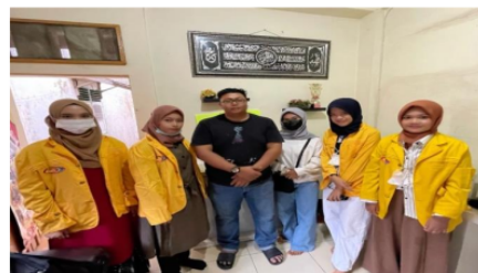
Gambar 2 Dokumentasi Kegiatan Dengan Pemilik UMKM