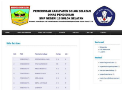
Gambar 17. Tampilan Data Siswa