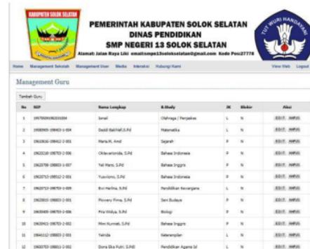
Gambar 7. Manajemen Guru

Form manajemen guru pada admin ini berfungsi agar admin dapat melakukan penambahan, pengeditan, dan penghapusan data guru. Untuk masuk ke dalam manajemen guru terlebih dahulu klik manajemen user dan manajemen guru, seperti pada gambar 7.