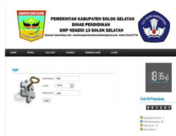
Gambar 20. Login Menu Siswa

Untuk dapat melakukan akses pada sistem E-Discussion ini siswa harus login terlebih dahulu dengan cara mengisi data login, seperti pada gambar 20.