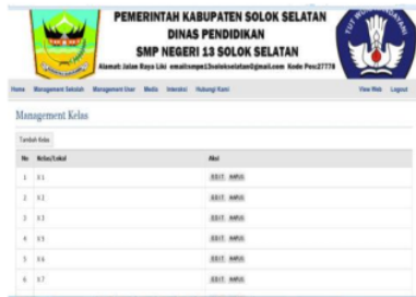
Gambar 5. Manajemen Kelas