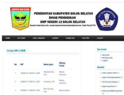
Gambar 22. List Guru

Form list guru SMP 13 Solok Selatan pada login siswa ini berfungsi agar siswa dapat melihat data-data guru. Tampilan list guru SMP 13 Solok Selatan dapat dilihat setelah mengklik list guru seperti pada pada Gambar 22.