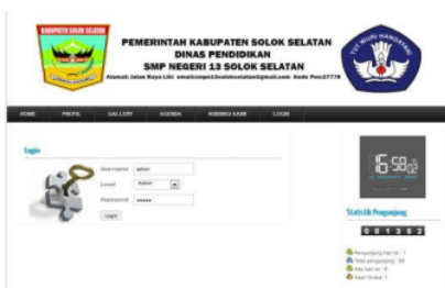
Gambar 2. Login Menu Admin

Untuk dapat melakukan akses data siswa dan guru, admin harus login terlebih dahulu. Tampilan menu log in dapat dilihat setelah mengklik log in dan mengisi data user seperti pada gambar 2.