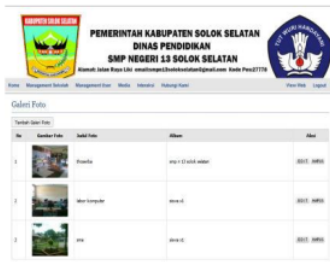
Gambar 10. Galeri Foto

Form galeri foto pada admin ini berfungsi agar admin dapat melakukan penambahan, pengeditan, dan penghapusan galeri foto. Untuk, masuk ke dalam galeri foto terlebih dahulu klik media dan galeri foto, seperti pada gambar 10.