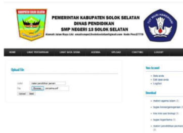
Gambar 19. Upload File