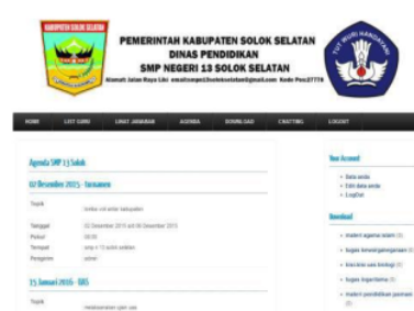
Gambar 24. Agenda

Form agenda SMP 13 Solok Selatan login siswa ini berfungsi agar siswa dapat melihat agenda sekolah. Tampilan agenda SMP 13 Solok Selatan dapat dilihat setelah mengklik agenda seperti pada gambar 24.