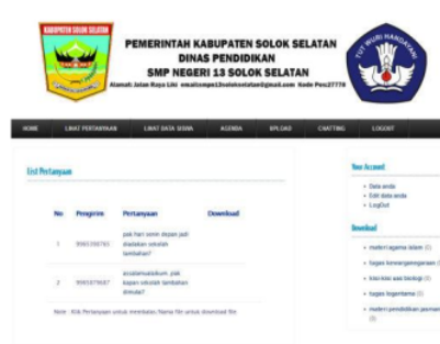
Gambar 16. List Pertanyaan

Form list pertanyaan pada guru ini berfungsi agar guru dapat melihat pertanyaan yang di ajukan siswa. Tampilan ini dapat dilihat setelah mengklik tombol list pertanyaan seperti gambar 16.