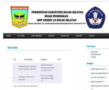
Gambar 23. Lihat Jawaban

dilihat setelah mengklik tombol lihat jawaban seperti pada Gambar 23.