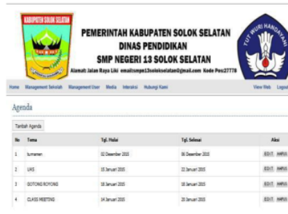
Gambar 11. Tampilan Agenda

Form agenda pada admin ini berfungsi agar admin dapat melakukan penambahan, pengeditan, dan penghapusan data agenda. Untuk, masuk ke dalam agenda terlebih dahulu klik interaksi dan agenda, seperti pada gambar 11.