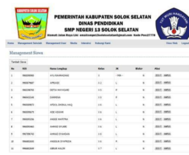
Gambar 8. Manajemen Siswa

Form manajemen siswa pada admin ini berfungsi agar admin dapat melakukan penambahan, pengeditan, dan penghapusan data siswa. Untuk masuk ke dalam manajemen siswa terlebih dahulu klik manajemen user, seperti pada gambar 8.