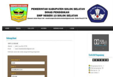
Gambar 13. Pengiriman Pesan Hubungi Kami

kami dapat dilakukan setelah mengklik hubungi kami seperti pada gambar 13.