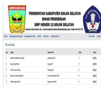
Gambar 12. Tampilan Dowload

Form download pada admin ini berfungsi agar admin dapat melakukan penambahan, pengeditan, dan penghapusan data download. Untuk masuk ke dalam download terlebih dahulu klik interaksi dan download, seperti pada gambar 12.