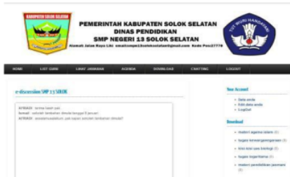
Gambar 25. Chatting

dilihat setelah mengklik chatting seperti pada gambar 25.