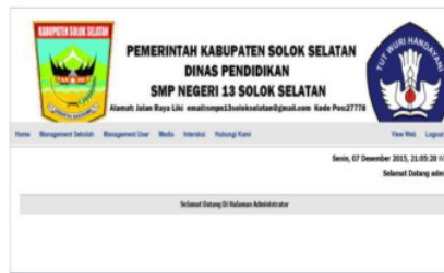
Gambar 3. Menu Setelah Login