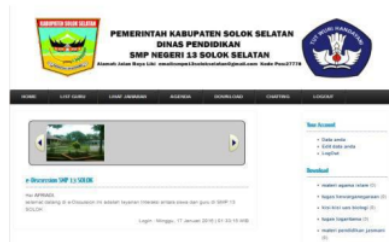
Gambar 21. Menu Siswa setelah Login