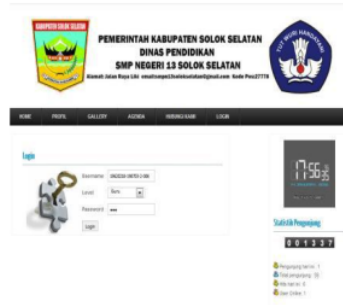
Gambar 15. Login Menu Guru

Untuk dapat melakukan akses data siswa, guru harus login terlebih dahulu. login dapat dilakukan dengan mengklik tombol login dan mengisi data login seperti gambar 15.