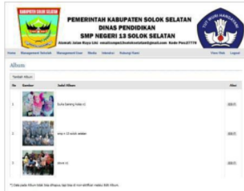
Gambar 9. Tampilan Album

dahulu klik media dan album, seperti pada gambar 9.