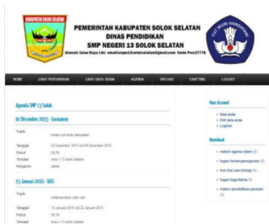
Gambar 18. Tampilan Agenda

Form agenda SMP 13 Solok Selatan pada guru ini berfungsi agar guru dapat melihat agenda sekolah SMP 13 Solok Selatan. Tampilan agenda SMP 13 Solok Selatan dapat dilihat setelah mengklik agenda seperti pada gambar 18.