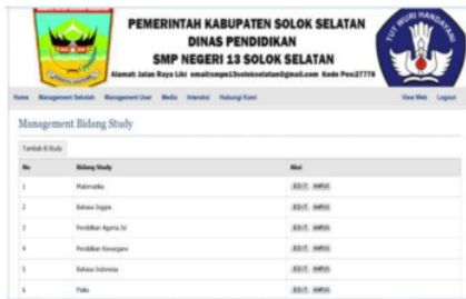
Gambar 6. Manajemen Study

Form manajemen study pada admin ini berfungsi agar admin dapat melakukan penambahan, pengeditan, dan penghapusan pelajaran. Untuk masuk ke dalam manajemen study terlebih dahulu klik manajemen sekolah dan manajemen study, seperti gambar 6.