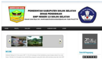
Gambar 1. Menu Utama