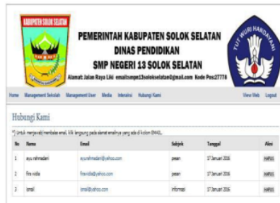
Gambar 14. Hubungi Kami pada Admin

Home hubungi kami digunakan dengan memakai email oleh guru dan siswa dan juga admin yang akan membalas pesan-pesan yang diterima. Tampilan hubungi dapat dilakukan dengan mengklik nama email guru atau admin seperti pada gambar 14.