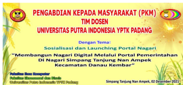
Gambar 3. Spanduk Kegiatan PKM

Selanjutnya setelah kami mendapatkan izin untuk melaksanakan PKM maka kami membuat dan merancang Website atau Portal Pemerintah 4 Nagari yang menjadi lokasi kami melakukan kegiatan PKM yaitu Nagari Simpang Tanjung Nan Ampek, Kecamatan Danau Kembar, Kabupaten Solok, Profinsi Sumatera Barat. Alamat website / portal pemerintahan nagari tersebut adalah: