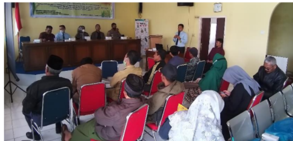
Gambar 5. Kegiatan Pelatihan Penggunaan Website Nagari

Selanjutnya setelah website / portal pemerintahan nagari tersebut selesai kami buat dan kami hosting di internet maka kami melakukan pelatihan dan pendampingan dalam literasi digital dan penggunaan website / portal tersebut. Pelatihan kami lakukan selama 2 hari yaitu Senin dan Selasa tanggal 01 – 02 November 2021 dari Pukul 09:00 – 16:00 WIB dengan istirahat selama satu jam yaitu pukul 12:00 – 13:30 WIB sedangkan untuk pendampingan pertama kali kami lakukan langsung setelah pelatihan sedangkan pendampingan secara berkelanjutan kami lakukan selama 1 tahun secara online. Berikut dibawah ini foto kegiatan pelatihan dan pendampingan pada gambar 5 dan gambar 6.