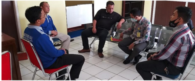
Gambar 1. Koordinasi dengan Mitra PKM

kegiatan PKM. Gambar 1 dibawah ini memperlihatkan kegiatan Koordinasi dengan Mitra PKM.