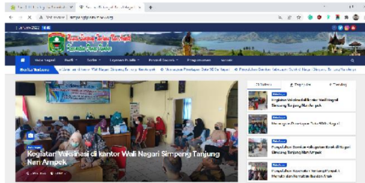
Gambar 4. Halaman Depan ( Home ) Website / Portal Pemerintahan Nagari

http://simpangtjnanampek.org/ . Berikut dibawah ini gambar 4 merupakan halaman depan (Home) website / portal yang kami buat.