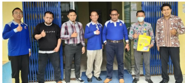
Gambar 2. Sosialisasi di lokasi Kegiatan PKM

Pada tahap pelaksanaan ini pertama kali kami melakukan sosialisasi dan pembuatan spanduk promosi portal pemerintahan nagari. Sosialisasi kami lakukan dengan mengunjungi kantor wali nagari tersebut dan menyampaikan surat permohonan izin untuk melaksanakan kegiatan PKM selanjutnya kami mendisain spanduk untuk pelaksanaan kegiatan PKM. Berikut 31 dibawah ini foto kegiatan Sosialisasi dan Spanduk kegiatan PKM ini dilihat pada gambar 2 dan 3.