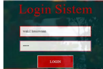
Gambar 3. Halaman Login

Halaman utama yang bisa diakses adalah halaman Login, dimana Wakil Kesiswaan harus memasukkan username dan password , seperti pada Gambar 3.