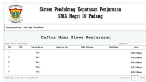
Gambar 3. Hasil Menggunakan SAW