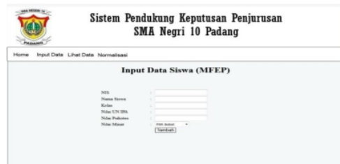
Gambar 2. Analisis Menggunakan MFEP

Gambar 2 – 5 merupakan hasil analisis dan penerapan.