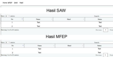
Gambar 5. Perbandingan Hasil Analisis