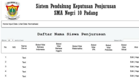
Gambar 4. Hasil Menggunakan MFEP