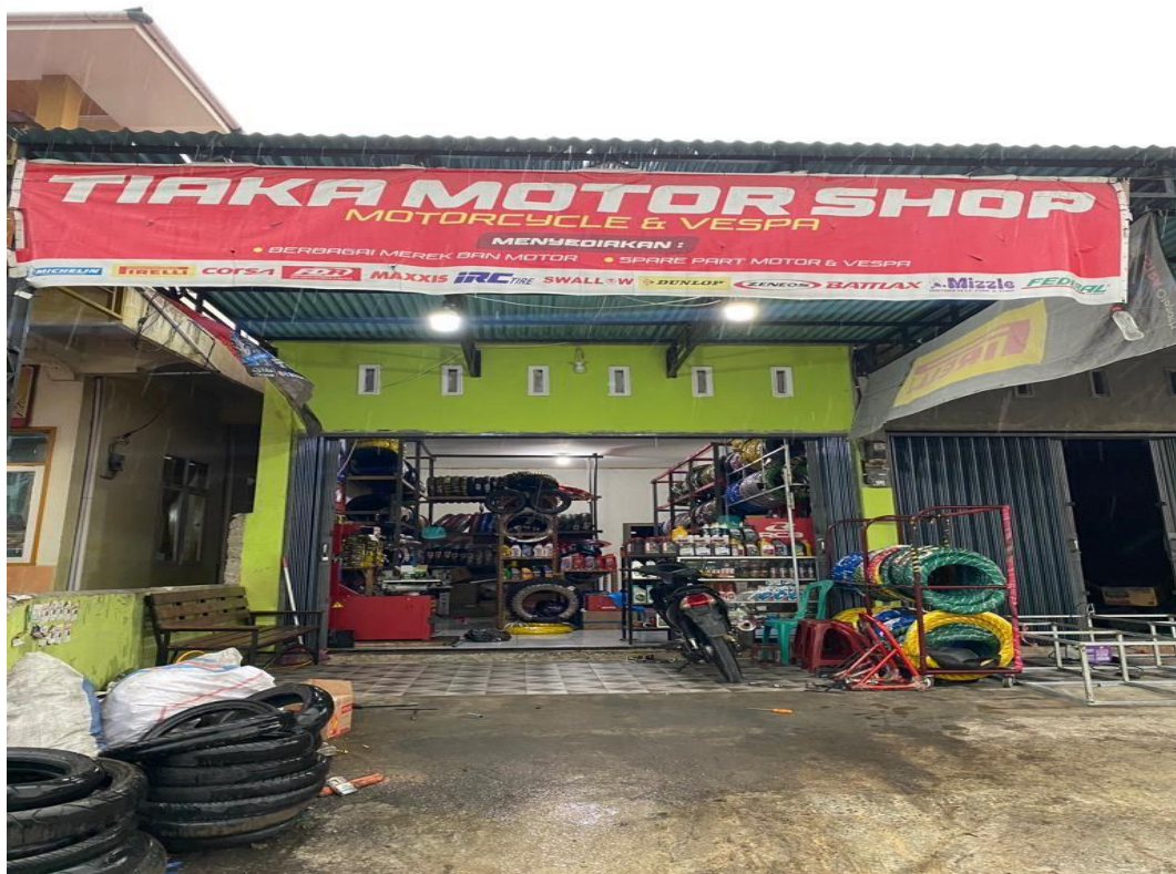
Gambar 1.1 Tampilan Depan Toko Tiaka Motor

Toko Tiaka Motor adalah sebuah usaha yang bergerak dibidang penjualan sparepart & aksesoris sepeda motor. Toko Tiaka Motor berlokasi di Simp. Canduang, Agam, Sumatera Barat. Sistem yang saat ini digunakan masih menggunakan transaksi di tempat, sehingga pemilik ingin memperluas jangkauan penjualan di toko mereka dengan merancang sebuah website yang dapat melakukan transaksi secara online.