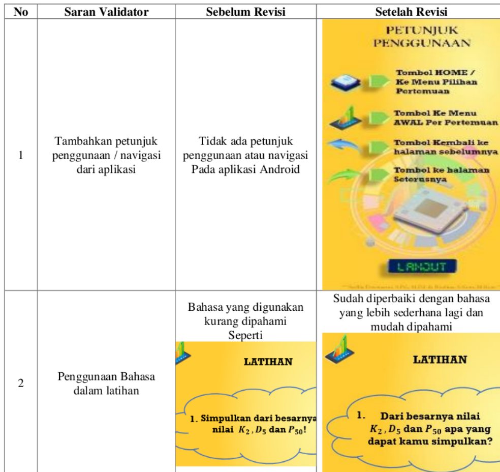
Tabel 4. Saran Validator dan Revisi Media Pembelajaran Statistika Berbasis Android

terakhir yaitu ahli bidang matematika Ibu Mishbah Uhusna, S.Si, M.Si memberikan komentar bahwa penyajian materi melalui media pembelajaran berbasis android sudah sesuai dengan RPS Statistika, sedikit diperhatikan pada penggunaan Bahasa dalam latihan kalimat perintah soal lebih jelas lagi agar mudah dipahami. Diharapkan dengan adanya media pembelajaran berbasis android ini meningkatkan pemahaman statistika mahasiswa. Beberapa saran dan hasil perbaikan dari pada validator, dapat dilihat pada Tabel 4 berikut.