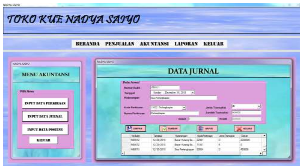
Gambar 4.6 Input Data Jurnal

Form Input Data Jurnal adalah form yang digunakan untuk data-data Jurnal, data-data yang di inputkan pada form ini adalah No.Bukti, Tanggal Transaksi, Keterangan, Kode Perkiraan dipilih maka akan muncul data-data perkiraan yang telah diinputkan sebelumnya, pilih Jenis Transaksi jika Jenis Transaksi Debet maka Jumlah Transaksi yang diinputkan akan muncul pada Debet, begitu juga dengan Kredit. Seperti yang dapat dilihat pada gambar 4.6 berikut :