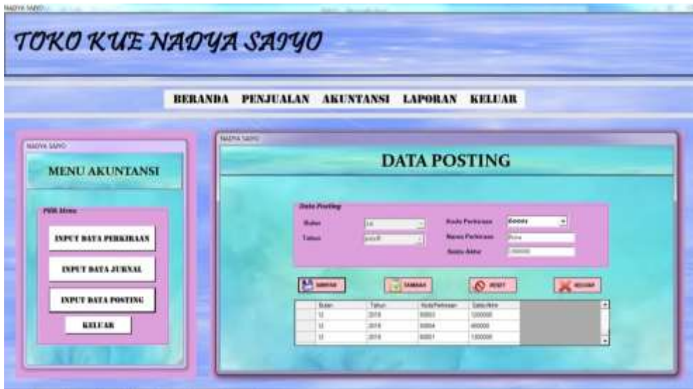
Gambar 4.7 Input Posting