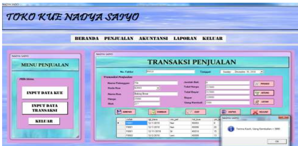
Gambar 4.4. Input Data Transaksi

Form Input Data Transaksi adalah form yang digunakan untuk melakukan Input Data Transaksi, data-data yang di inputkan pada form ini adalah Nomor Faktur, Tanggal Transaksi, Nama Pelanggan, Kode Kue dipilih maka akan muncul data-data Kue yang telah diinputkan sebelumnya, Jumlah Beli diinputkan, klik tombol Proses maka akan muncul hasilnya pada Total Harga dan Total Bayar, kemudian inputkan jumlah Bayar lalu klik tombol Hitung maka akan muncul uang kembalian dari jumlah Bayar. Seperti yang dapat dilihat pada gambar 4.4 berikut: