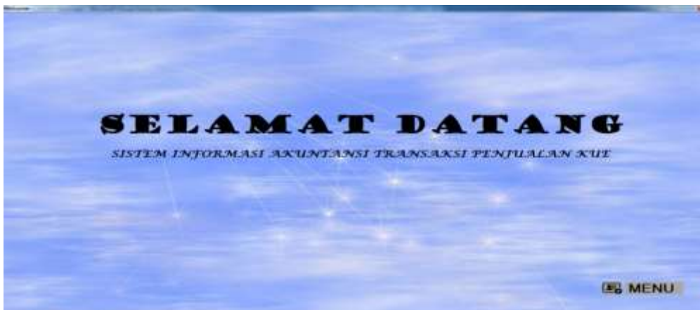
Gambar 4.1. Tampilan Awal Program

Form Tampilan Awal Program merupakan form yang utama terlihat pada saat program di run dan merupakan tampilan awal program, kemudian klik Menu untuk melihat tampilan Menu Utama. Seperti yang dapat dilihat pada gambar 4.1 berikut ini.