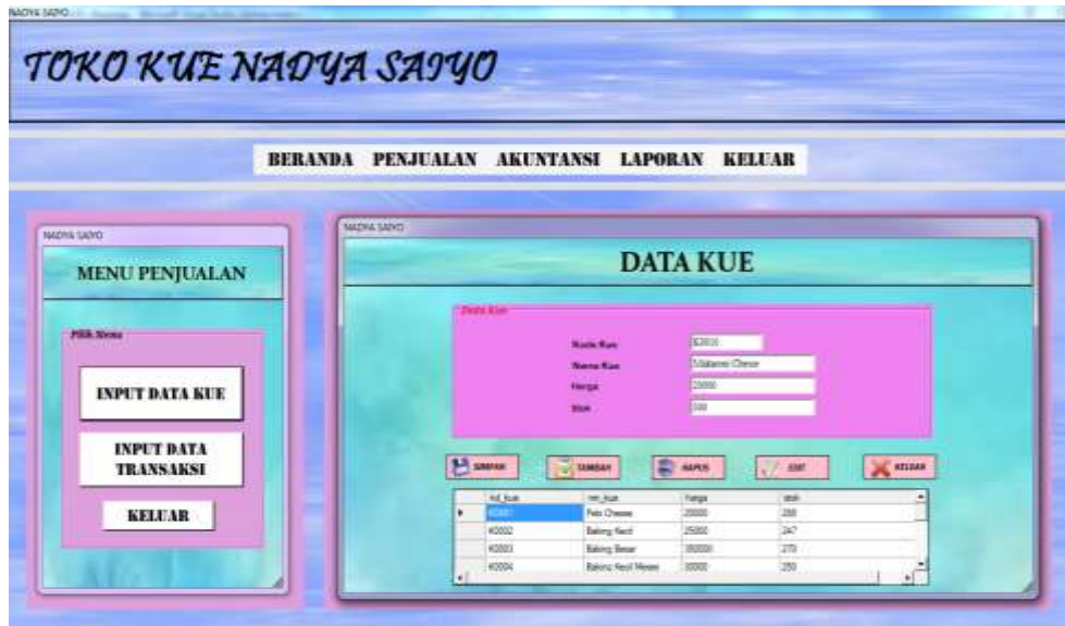
Gambar 4.3. Input Data Kue