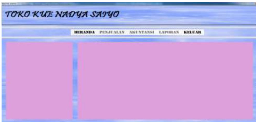
Gambar 4.2. Menu Utama

Form Menu Utama merupakan form yang terdiri dari Lima buah sub menu program, yaitu menu Beranda, Penjualan, Akuntansi, Laporan dan Keluar. Seperti yang dapat dilihat pada gambar 4.2 berikut :