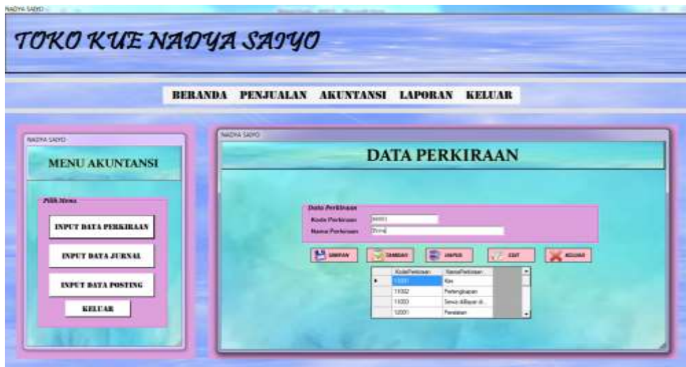
Gambar 4.5. Input Data Perkiraan