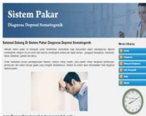
Gambar 1.2 Halaman Home

Halaman home merupakan tampilan awal saat user mengakses web gangguan depresi somatogenik. pada halaman home terdapat beberapa pilihan menu yang ada.