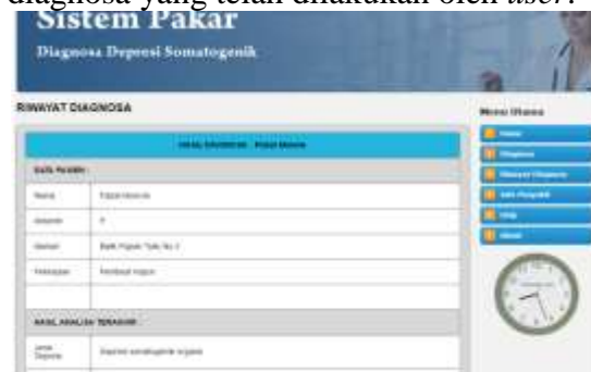
Gambar 1.5 Halaman Riwayat Diagnosa

Halaman ini merupakan tampilan saat telah melakukan diagnosa yaitu riwayat diagnosa, pada halaman ini menampilkan diagnosa yang telah dilakukan oleh user .