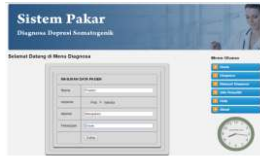
Gambar 1.3 Halaman Diagnosa (Masukan Data Pasien)

Halaman ini merupakan tampilan saat akan melakukan diagnosa, sebelum melakukan diagnosa user harus memasukkan data pasien terlebih dahulu.