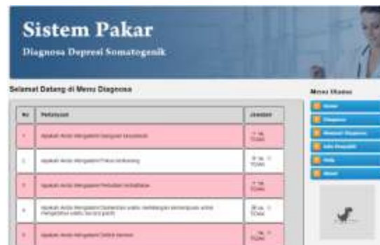
Gambar 1.4 Halaman Diagnosa

Halaman ini merupakan tampilan saat melakukan diagnosa, di mana pada halaman ini menampilkan beberapa pertanyaan yang akan diberikan kepada user tentang gejala-gejala yang diderita pada pasien.