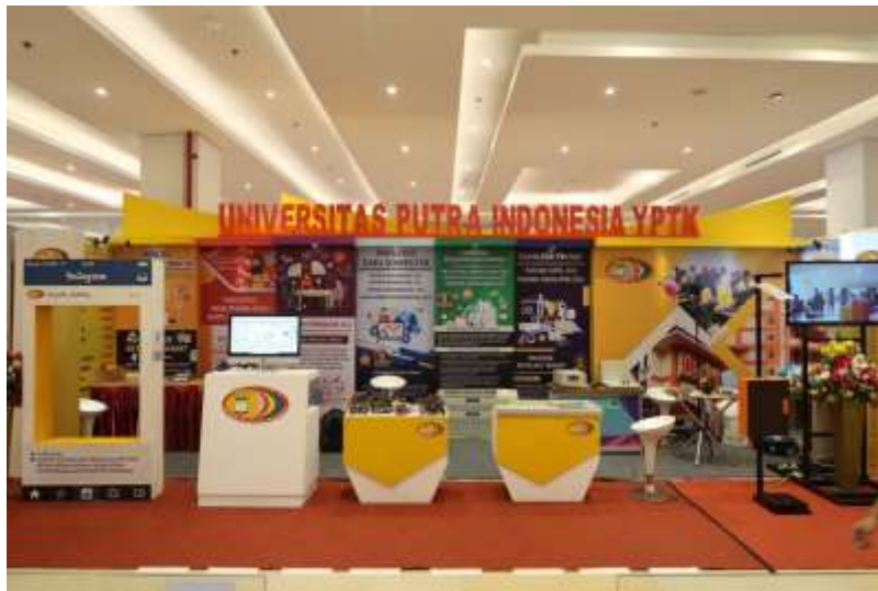
Gambar 13. Aktivitas Tim Marketing UPI “YPTK” Padang

Menurut Voklmann (2012) Terdapat beberapa konsep pemasaran yang dapat dilakukan oleh wirausaha: