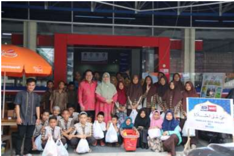
Gambar 2: Keteladanan Karakter Unggul Wirausaha dari Pimpinan UPI “YPTK” Padang

Karakteristik berhubungan dengan watak, perilaku, tabiat dan sikap seseorang dalam menjalani hidupnya. Karakteristik dalam kajian ilmu kewirausahaan dikaitkan dengan ciri-ciri perilaku yang dimiliki seseorang dalam proses berwirausaha. Mempelajari BAB II akan memberikan pengetahuan mengenai karakter dari seorang wirausaha yang dapat menunjang kesuksesannya. Materi ini terkait dengan materi sebelumnya mengenai konsep dasar wirausaha yang menyatakan bahwa pada dasarnya kewirausahaan memiliki kekhususan terhadap perilaku sukses yang ditunjukkan melalui proses berwirausaha terutama pada ciri tanggungjawab dalam mengambil resiko dan nilai inovasi serta kreativitas.