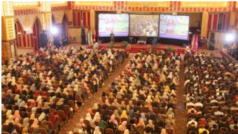
Gambar 3. Pendidikan Sebagai Upaya Pembentukan Karakter Wirausaha

Keberadaan faktor-faktor tersebut mempengaruhi pembentukan karakteristik wirausaha seseorang. Memilih untuk menjadi seorang wirausaha memang belum banyak tumbuh menjadi pilihan dikalangan