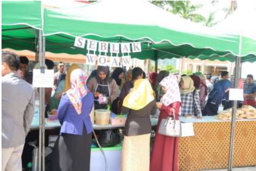
Gambar 6: Upaya Menjaring Ide Wirausaha Melalui Aktivitas Wirausaha Mahasiswa

dengan tujuan untuk memahami tentang: pengertian ide dan gagasan usaha dan bagaimana memunculkan ide kewirausahaan, metode mengenal gagasan usaha, gagasan usaha berbisnis melalui internet, cara melakukan identifikasi masalah dalam ide dan gagasan berwirausaha, cara dalam mencari gagasan usaha dengan metode ATM, Teknis penjaringan gagasan usaha, Mencari gagasan usaha dan sumber gagasan usaha.