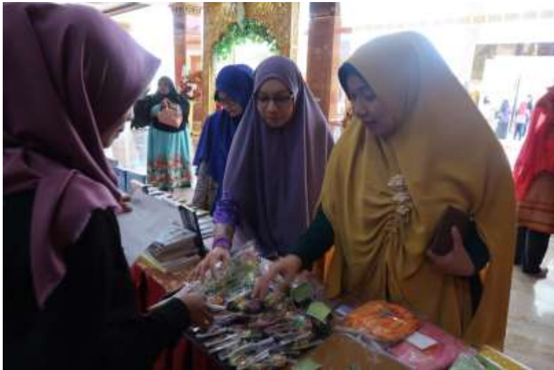
Gambar 11 . Dukungan Kampus UPI YPTK Padang dalam Managemen Usaha Kecil Mahasiswa

Secara garis besar penerapan manajemen dalam usaha besar dan kecil lebih menonjol pada fungsi dan tugas manager. Pada usaha berskala besar tugas manager telah dipilah-pilah sedemikian rupa sesuai strategi dan struktur organisasi yang tertata secara bertingkat. Pada usaha kecil, seluruh sumberdaya sangat terbatas, fungsi dan tugas seorang manager berbaaur menjadi satu karena memang dalam usaha kecil belum diperlukan manager. Manager pada usaha kecil seringkali juga merupakan pendiri atau pemilik.