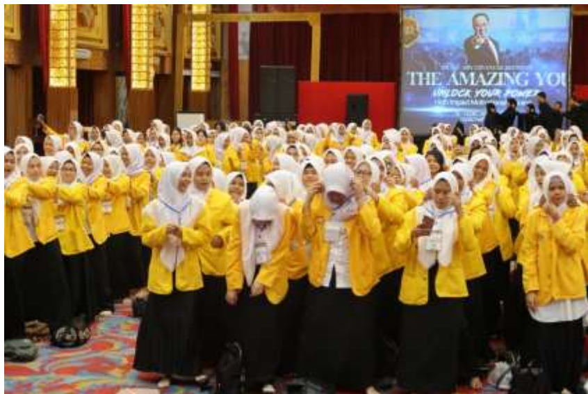
Gambar 4: Kegiatan Pengembangan Potensi Diri Mahasiswa UPI "YPTK" Padang

Bagian ini penting memberikan pengetahuan pada pembaca tentang bagaimana menjadi pelaku kegiatan wirausaha dapat memiliki karir sukses dalam berwirausaha, mampu menentukan bidang usaha yang dijalannya sesuai dengan potensi, bakat dan minat seseorang. Hal ini bertujuan agar lebih mudah bagi mereka untuk mewujudkan keberhasilan usaha. Karena seseorang yang diarahkan pada hal yang mereka suka akan lebih besar kecenderungan keinginan mengambil resiko, bertanggungjawab dan memunculkan kreatifitas dalam aktivitas usahanya.