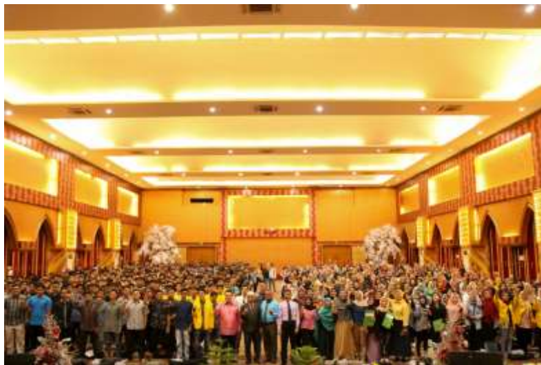
Gambar 1: Civitas Akademika UPI “YPTK” Padang dalam Mendukung Aktivitas Kewirausahaan Mahasiswa

Setiap orang memiliki persepsi yang tidak sama tentang istilah wirausaha. Sebagian besar menganggap bahwa wirausaha adalah seseorang yang berniaga, berjualan atau mendapatkan penghasilan melalui kegiatan berjual beli. Memang tidak salah jika wirausaha diidentikkan dengan seseorang yang berniaga atau berjualan, namun patut diketahui bahwa pengertian wirausaha tidak sesempit pengertian penjual, pedagang ataupun pengusaha. Terdapat keistimewaan dari seorang yang diistilahkan dengan wirausaha, mereka tidak dapat disamakan begitu saja dengan seorang penjual, seorang pedagang maupun seorang pengusaha. Untuk mengenal dengan lebih mendasar mengenai istilah kewirausahaan pada bagian ini akan dikemukakan definisi-definisi tentang wirausaha dan kewirausahaan.