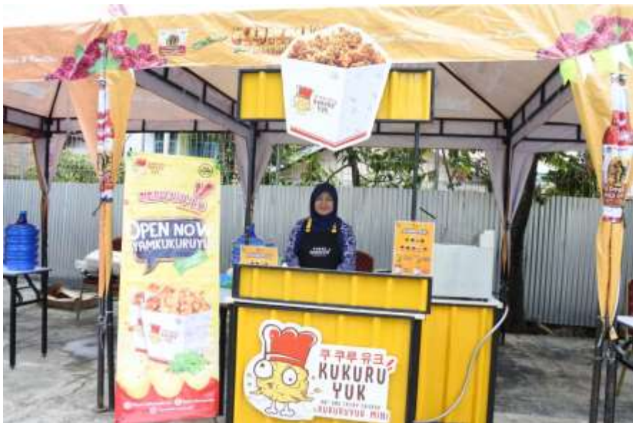
Gambar 8. Kreativitas Wirausaha Mahasiswa UPI “YPTK” Padang

Kepandaian dalam membaca peluang bisnis penting dimiliki dan diasah oleh seorang wirausaha. Karna ide bisnis muncul dengan membutuhkan kepandaian dan kreativitas dalam mengaktualisasinya. Realitis dari ide yang dimunculkan perlu mendapatkan dukungan dari karakteristik yang ada didalam diri seorang wirausaha. Seorang wirausaha membutuhkan kepandaian dalam membaca peluang bisnis, mengamati kondisi sekitar, berfikir kreatif untuk menentukan suatu bisnis apa yang mungkin banyak diminati oleh para konsumen.