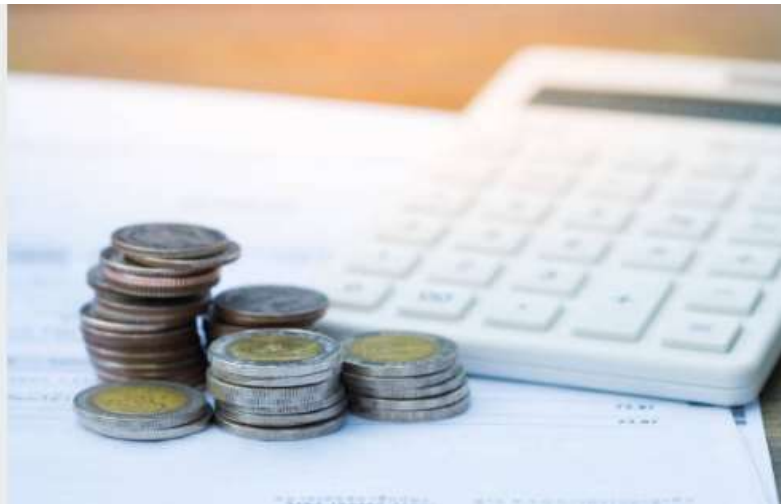
Gambar 12: Manajemen Keuangan

mempertahankan Keunggulan kompetitif sebuah perusahaan. Menurut Collinson dan Shaw (2001), menyatakan bahwa para Wirausaha dapat memperhatikan bagaimana pemasaran menjadi kunci sukses dengan melakukan inovasi dan kreativitas. Istilah Wirausaha Marketing ( Marketing Entrepreneur ) hadir untuk menggambarkan kegiatan pemasaran usaha kecil dan baru sekitar tahun 1980. Marketing Entrepreneur mewakili eksplorasi cara-cara di mana perilaku kewirausahaan dan perilaku pasar dapat terjadi dan Diterapkan pada pengembangan strategi pemasaran.