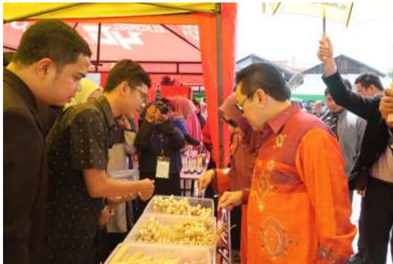
Gambar 5: Kegiatan Wirausaha Mahasiswa UPI “YPTK” Padang

kegiatan kewirausahaan menggunakan teknologi internet, Kerugian dalam melaksanakan kegiatan kewirausahaan, Kerugian dalam melaksanakan kegiatan kewirausahaan melalui teknologi internet, Penyebab kegagalan dalam berwirausaha dan kegagalan wirausaha menggunakan teknologi internet, Saran-saran yang dianjurkan untuk dapat sukses dalam kegiatan berwirausaha dan saran bagi kesuksesan wirausaha menggunakan teknologi internet.