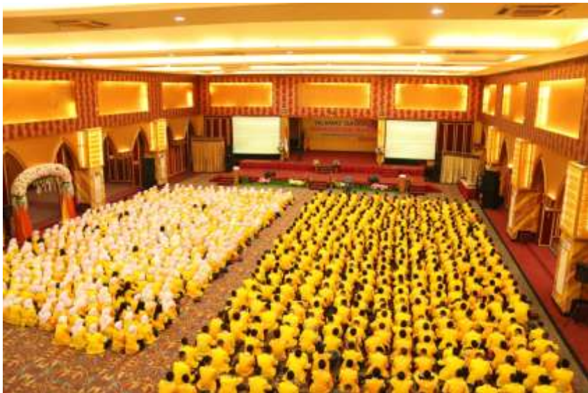
Gambar 10: Pembentukan Sikap Disiplin pada Mahasiswa Calon Wirausaha

Pengelolaan manajemen dalam berwirausaha dibutuhkan agar usaha yang dilaksanakan benar-benar memiliki arah yang terukur dan terencana dengan baik. Manajemen menjadi pengendali dari kegiatan usaha untuk memastikan bahwa usaha yang dilakukan berjalan sesuai dengan arah tujuan usaha. Manajemen dibutuhkan tidak hanya untuk usaha yang baru didirikan, namun seluruh unit usaha yang sedang berjalan membutuhkan manajemen yang baik. Marzuki Usman (2000), pengertian kewirausahaan dalam konteks manajemen adalah kemampuan dalam menggunakan sumber daya, seperti finansial, bahan mentah dan tenaga kerja untuk menghasilkan suatu produk baru, bisnis baru, proses produksi ataupun pengembangan organisasi.