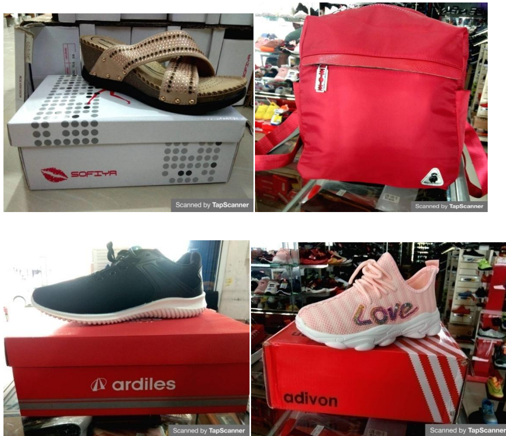
Gambar 1.3 Contoh Produk Toko Berkah

Produk merupakan barang atau jasa yang dapat diperjualbelikan pada Toko Berkah. Contoh produk yang ada pada Toko Berkah dapat dilihat pada gambar 1.3 berikut :